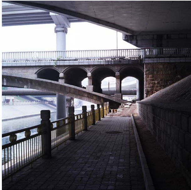
tianningsi qiao / xuanwumen xidajie 39°53'47.05"N / 116°20'36.61"E 07/06/09 / 15h30