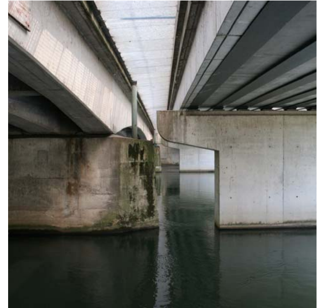
sous A35 rue des Imprimeurs 48°34'19.96" N / 7°43'50.75" E 10/09/09 / 14h26