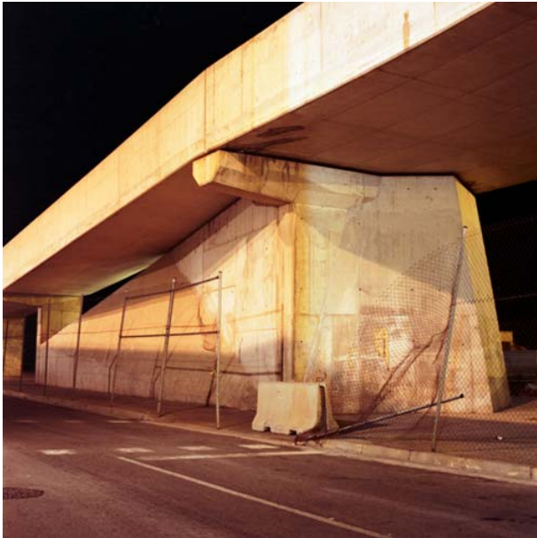
forum 41°24'33.11"N / 2°13'21.57"E / 15/06/09 / 23h10